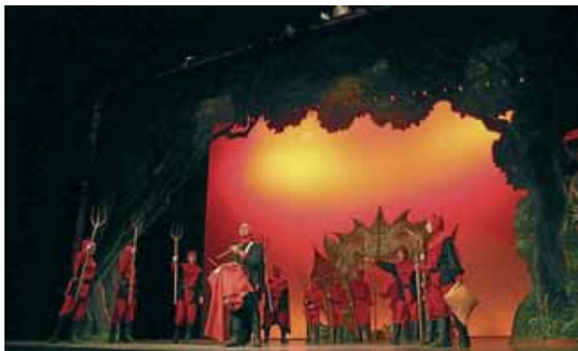
Enguany els Pastorets d'Ulldecona presenten algunes novetats.

11 i 18 i 26 de desembre. A les 18 h (dia 26 a les 19 hores) al teatre municipal Orfeó Montsià. Preu: 5 euros. www.passiulldecona.org