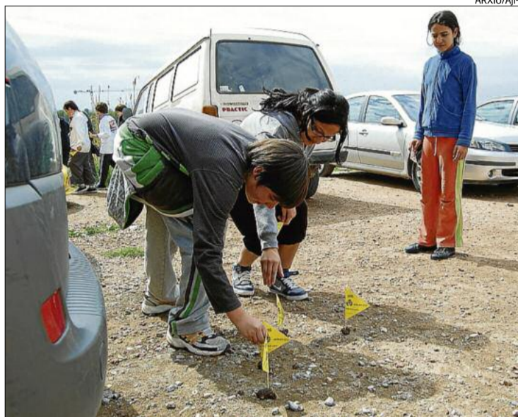
Nens del Consell d'Infants en l'acció cívica que van fer fa dos anys

A Manresa no és la primera vegada que el consistori es proposa eliminar aquest problema. Si bé no ha avançat en què consistiran les mesures, la previsió és que incloguin una part més pedagògica i una altra de més expeditiva.