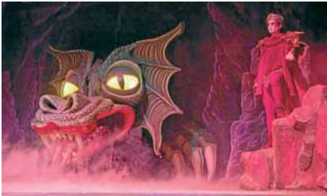
Pastorets de Súria, amb text de Folch i Torres

Fins després de Reis. A diferents teatres. www.pastoretsdecatalunya.cat