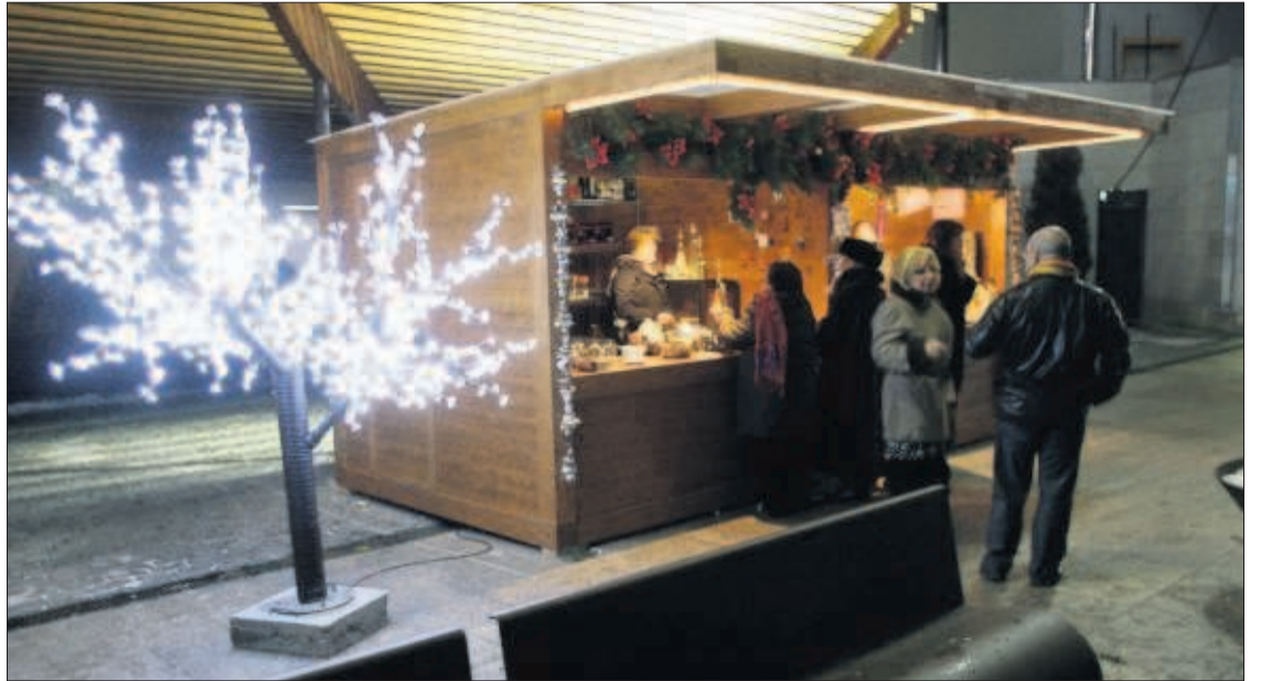
Visitants en una edició anterior del mercat de Nadal de la Massana.

LA MASSANA | LES PARADES TORNARAN A ESTAR A L'AIRE LLIURE