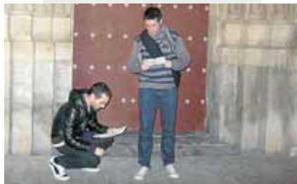
Un dels assajos a les portes de Sant Joan